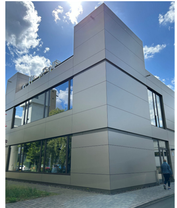
neues Natrium-Ionen Pouch-Zellen Labor@HZB (Wannsee)